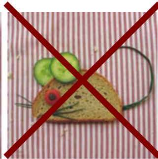
zeigen: 1. Seite