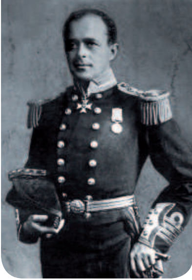
Robert Falcon Scott in Galauniform